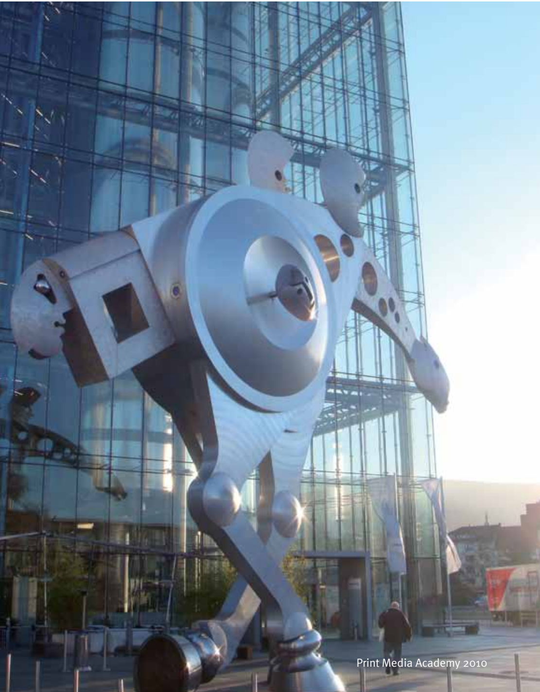
Print Media Academy 2010